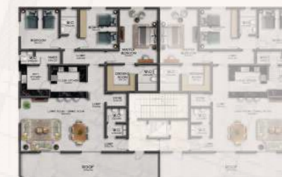
شقة رقم 1 غربية المساحة الاجمالية: 181.65 م 2 مساحة السطح: 41.11 م 2