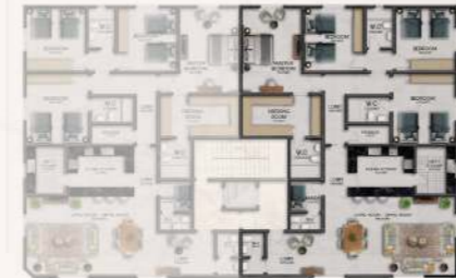
شقة رقم 2 شرقية المساحة الاجمالية: 221.87 م 2