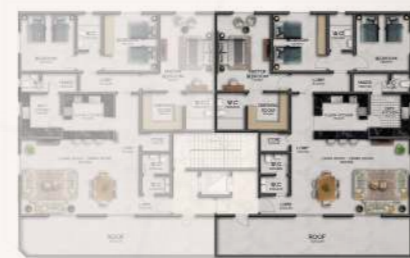
شقة رقم 2 شرقية المساحة الاجمالية: 181.56 م 2 مساحة السطح: 41.24 م 2