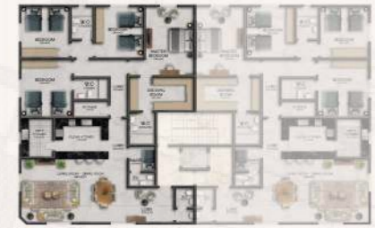
شقة رقم 1 غربية المساحة الاجمالية: 221.73 م 2